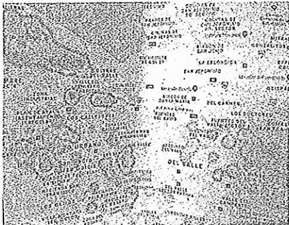
Vecinos ruidosos se concentran al norponiente.