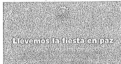
Las multas en San Pedro inician hoy.

También Santa Catarina mantiene este margen de límite de ruido en las colonias López Mateos, Residencial Cuauhtémoc, Infonavit la Huasteca y Santa Catarina Centro.